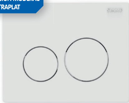
Plaque de commande Sphère blanche