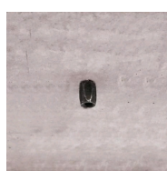
Rapido - Vue en situation