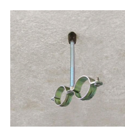
Rapido M7 - vue en situation