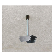
Rapido M6 - vue en situation