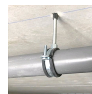
Rapido M8 - vue en situation