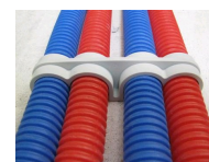
FIX-RING Quadruple vue en situation