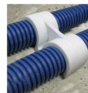
FIX-RING Double - vue en situation