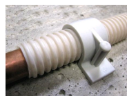
FIX-RING Simple - vue en situation