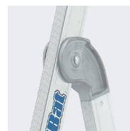
Articulation et plate-forme en fonderie d'aluminium