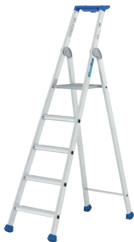
Modèle 5 marches

Le Maxibat est un marchepied en aluminium pour un usage intensif. Il répond à la norme EN 131 et au décret 96 333 et est labellisé NF. Ses sabots enveloppants, ses marches de 80 mm striées et sa plate-forme large font du Maxibat un marchepied sûr. Disponible de 3 à 10 marches, il permet d'accéder en toute sécurité à une hauteur maximum de 4,28 m sur un repose-pieds de 280 x 250 mm. Il dispose d'un porte-outils avec un crochet porte-seau.