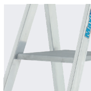
Repose-pied 280 x 250 mm