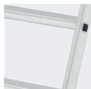
Marches striées 80 mm antidérapantes serties sur les montants