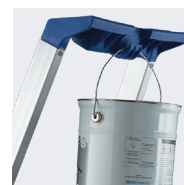
Crochet porte-seau 10 kg MAX