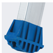
Sabots enveloppant antidérapants réf. 09007055