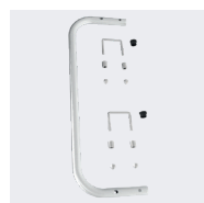
Rampe de montée en option. Réf. 02376450

2 sangles de sécurité du 7 au 10 marches. Le repose-pieds est considéré comme une marche. La béquille arrière des modèles 9 et 10 marches est renforcée par un croisillon. Livré emballé sous film avec PLY.