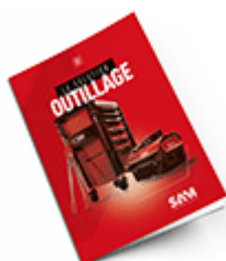
Outils de Travaux OUTILLAGE SAM 2021