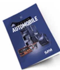
Automobile SAM 2021