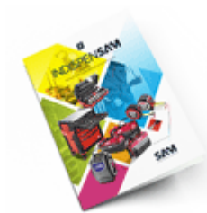
Les outils Indispensables SAM 2021

Découvrez tous nos produits dans nos catalogues en ligne