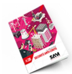
Sécurité anti-chute SAM 2020