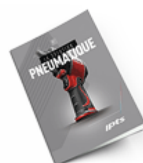
Pneumatique SAM 2021