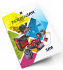
Les outils Indispensables SAM 2021

Découvrez tous nos produits dans nos catalogues en ligne