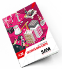
Sécurité anti-chute 2020