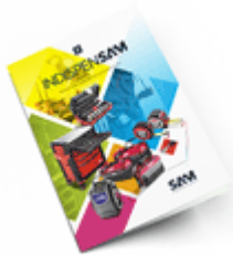
Les outils Indispensables SAM 2021

Découvrez tous nos produits dans nos catalogues en ligne