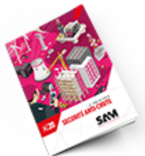
Sécurité anti-chute 2020