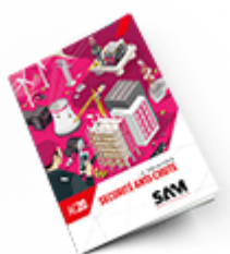
Sécurité anti-chute 2020