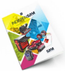
Les outils Indispensables SAM 2021

Découvrez tous nos produits dans nos catalogues en ligne